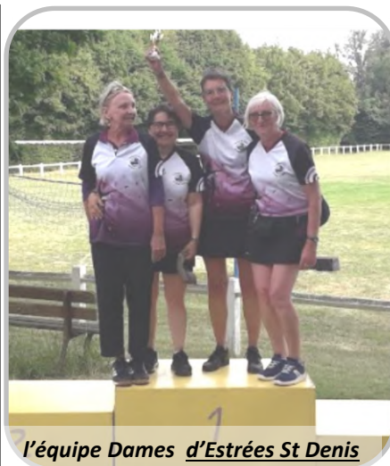
l'équipe Dames d'Estrées St Denis

Il faut effectivement souligner les efforts d'un club pour dynamiser et inscrire une équipe Dames, ce qui n'est pas toujours simple.